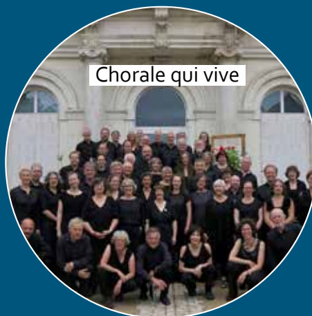
Chorale qui vive