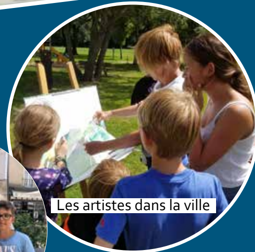
Les artistes dans la ville