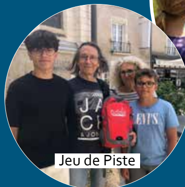
Jeu de Piste