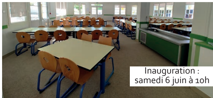
Inauguration : samedi 6 juin à 10h

Cette réalisation illustre la volonté de notre municipalité d'offrir à son personnel de restauration un environnement de travail sain, confortable et sécurisé, tout en maîtrisant les consommations énergétiques de ses équipements.